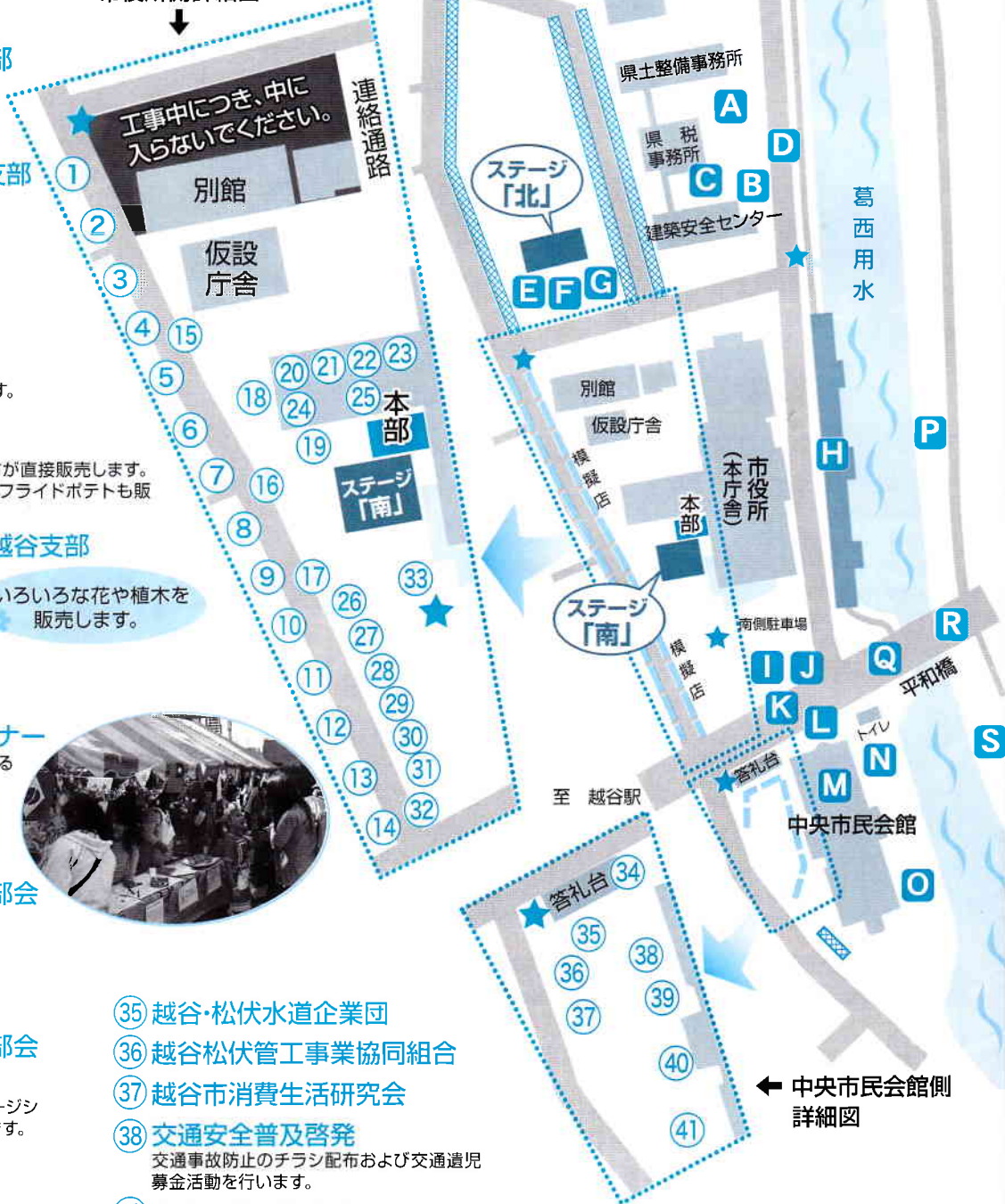
← 中央市民会館側詳細図